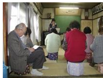
皆さん大きな声で歌っています↑