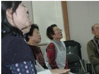
←皆さん大きな声で歌ってくれました♪

午前に「ときわ会」という町会の集まりがあり、それに合わせて午後にふれ健が行われることになりました。ふれ健の内容は、歌・体操・パターゴルフで、